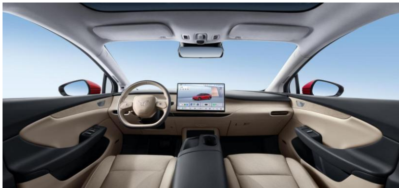
红旗天工 05 中控

在高性能显示指标方面，展示了 氧化物、LTPS 及超高清技术 对汽车座舱的创新赋能。氧化物技术领域，引领行业技术革新，开创了大尺寸氧化物车载显示产品量产的先河。氧化物技术因其高透过率、高对比度、高色域、低功耗等一系列显示方面的优秀特性，成为国内外主流车企中控大屏的绝佳选择。本次车展上，零跑汽车全新发布的零跑 B10，搭载京东方精电赋能的 14.6 英寸氧化物中控屏，具备高透过率、高对比度、高色域、低功耗等优势，提升汽车座舱的智能化和科技感；LTPS 技术领域，为蔚来子品牌 Firefly（萤火虫）全新车型独家打造 13.2 英寸 LTPS 悬浮式中控屏幕，以 2560*1600 的超高分辨率为驾驶者呈现细腻流畅的画面，搭配京东方精电 LTPS 技术原生节能优势，相比传统屏幕能够实现功耗的显著降低；超高清领域，以“屏幕+美学+智能”三位一体解决方案助力红旗汽车发力新能源赛道，为红旗汽车新能源转型的核心车型赋能——红旗天工 05 及红旗天工 08 分别搭载京东方精电 15.6 英寸高清中控和 6 英寸、15.49 英寸曲面双联屏，重塑豪华座舱数字化体验标准。