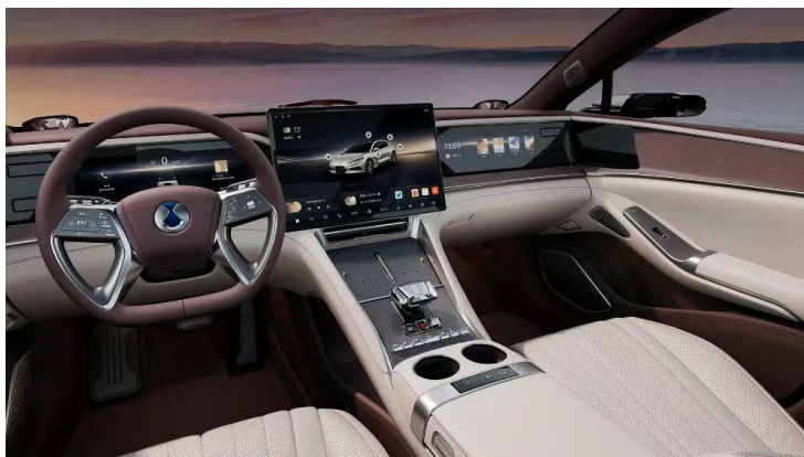
腾势 Z9 GT

在颁奖仪式结束后，京东方精电的代表与比亚迪管理层及行业领军企业代表进行了深入的交流。双方就新能源汽车行业的最新趋势、技术创新及未来发展方向等话题展开了热烈讨论，共同展望了新能源汽车产业的广阔前景。